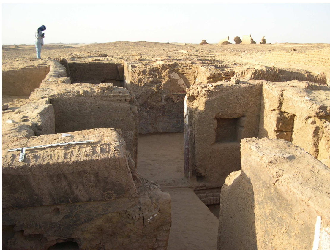
Afbeelding 2. Een kijkje in de 4 e -eeuwse woning in het centrum van Amheida. Achter de deuropening in het midden van de foto ligt de ontvangstruimte