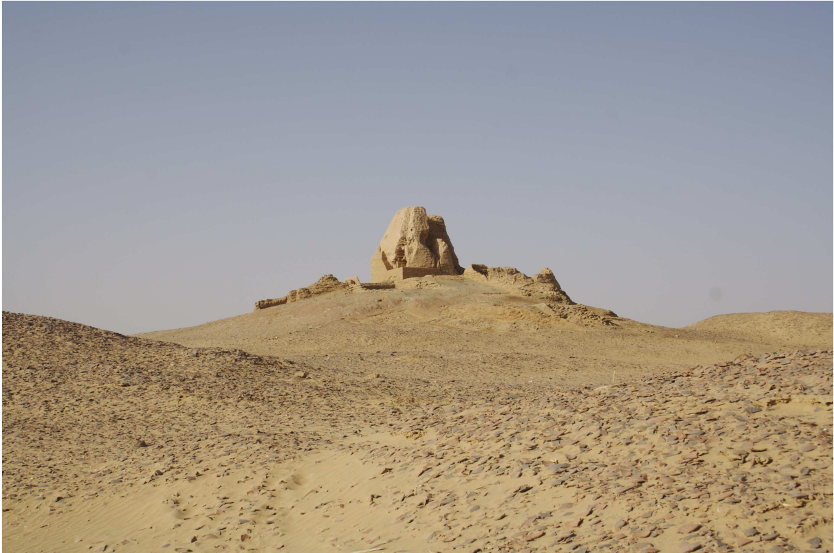
Afbeelding 5. De piramide van Amheida na restauratie in 2006 en 2007 te midden van andere funeraire structuren. Op de voorgrond zijn de vele scherven die het oppervlak van de site bedekken duidelijk zichtbaar