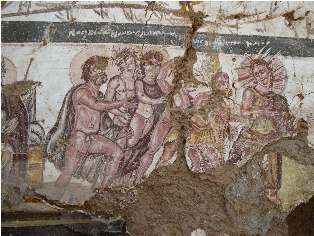
Afbeelding 3. Olympische goden bijeen als getuigen van het overspel van Aphrodite en Ares, die rechts van de hier afgebeelde goden het bed delen. Middels Griekse bijschriften zijn de levendig geschilderde figuren te identificeren als (van links naar rechts) Poseidon, Dionysos, Apollo, Hermes, Hephaistos en tenslotte Helios