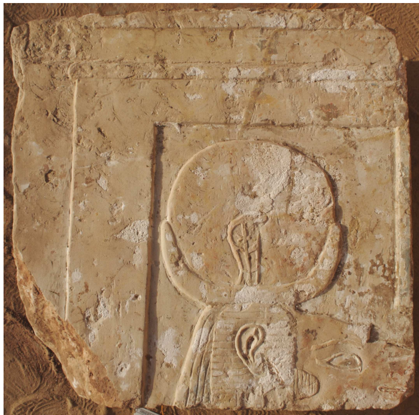
Afbeelding 4. Thot in zijn gedaante als baviaan met maansikkel en -schijf, alsmede een beschermende cobra, op een blok afkomstig van de aan deze god gewijde tempel in Amheida